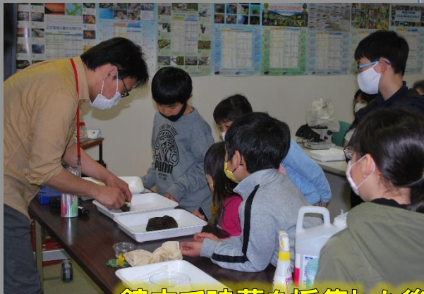
館内で珪藻を採集した後にプレパラートを作ります。