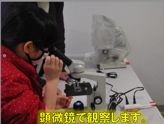
顕微鏡で観察します。