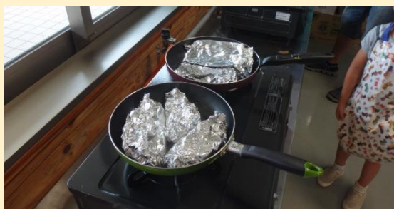
ホイルに包んで焼きます。