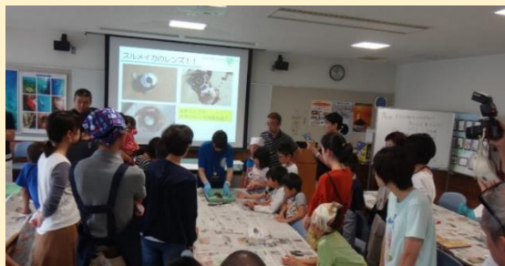
イカの体の仕組みを説明します。

【主催】 福井県海浜自然センター 【連携】 福井ライフ・アカデミー、福井大学CST