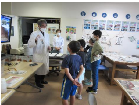
金と銀の実験教室