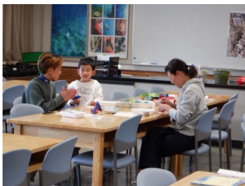
クリスマスカード作り