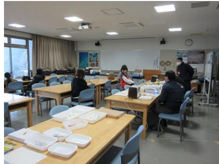
タツノオトシゴキーホルダー作り