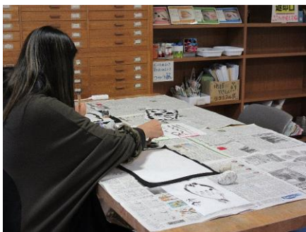
いか墨で書き初め