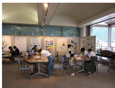
プニプニ海の生きもの作り