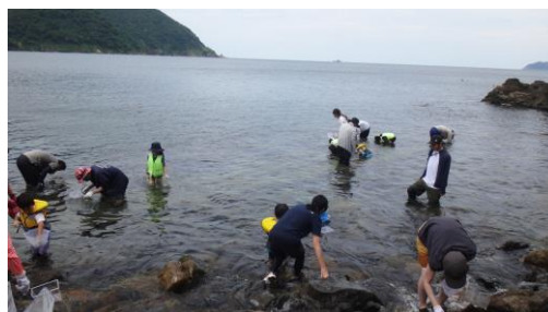
磯の生きもの観察