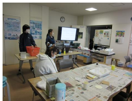
珪藻土コースター作り