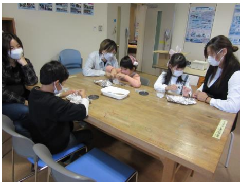
海のジェルキャンドルホルダー作り