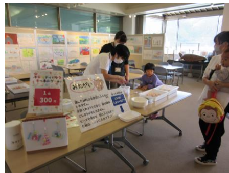
キャンディバッグキーホルダー作り