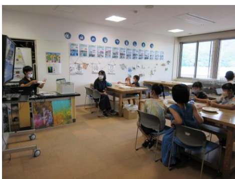
チリメンモンスター