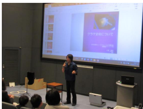
海の生きもののお話し・マジックショー