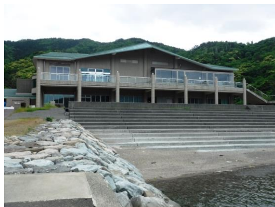
海側から見た海浜自然センター