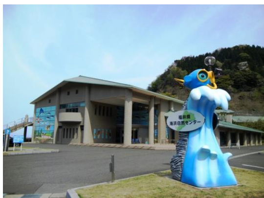
国道側から見た海浜自然センター

また、平成17年には、三方五湖がラムサール条約湿地に登録されたことにより、従来の若狭の海を中心とした展示に加え、三方五湖の自然環境や自然再生活動を紹介するなど、三方五湖のビジターセンターとしての役割を担ってきました。平成26年4月には「うみ（海湖）のビジターセンター」としてリニューアルオープンし、嶺南地域の自然環境保全の重要性を紹介するとともに、学ぶ普及啓発施設として皆様にご利用いただくことを目的に運営しています。