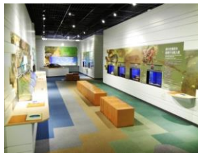
若狭湾の生きものたち