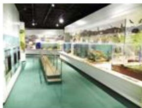
三方五湖とその周辺の生きもの