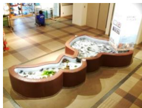
福井の海にタッチしよう