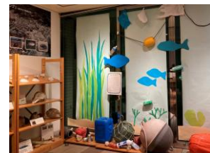
ビーチコーミング